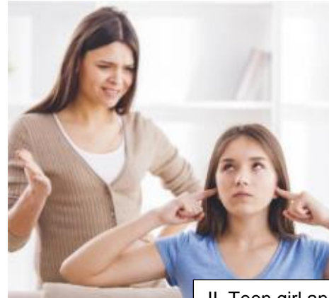
II. Teen girl and her mom having an argument.