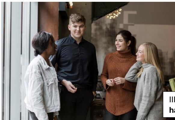
III. Teenage friends hanging out.