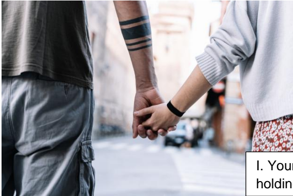
I. Young couple holding hands.